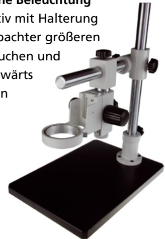
DZ.5020 Universal Stativ ohne Beleuchtung

Ein universelles Stativ mit Halterung ermöglicht die Beobachter größeren Objekten zu untersuchen und die Stereo-Kopf auswärts zu verschieben wenn notwendig