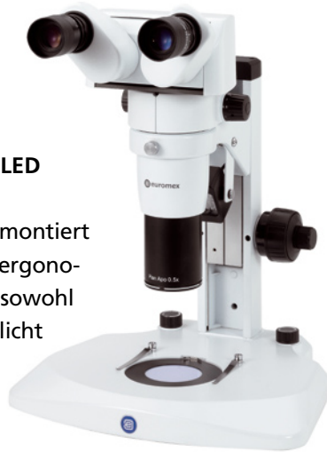
DZ.1800 mit ergonomische stereoskop

Die DZ Reihe kann montiert werden auf einem ergonomischen Stativ, mit sowohl Auflicht und Durchlicht LED-Beleuchtung. Beide Beleuchtungen können getrennt eingestellt werden